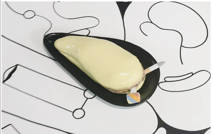
Mrzyk & Moriceau – Meilleurs Vœux de la Jamaïque au Mrac à Sérignan

Une bande de moules eut aussi une vision en échange de quelques cigarettes : prudence, les artistes devaient faire très attention sur le choix des épingles qu'ils utiliseraient pour accrocher leurs dessins. Certaines étaient ensorcelées et pouvaient contaminer le papier. En conséquence, ces moules leur conseillèrent d'utiliser de la Patafix jamaïcaine, sorte de pâte à galette multi-usage très utile.