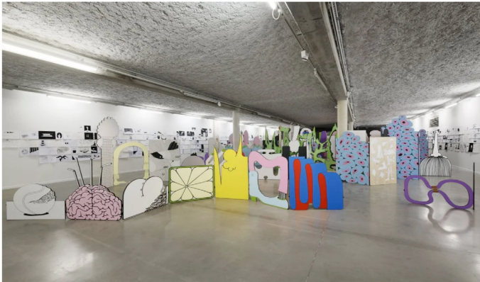
« Meilleurs vœux de la Jamaïque », vue de l'exposition de Mrzyk & Moriceau au Mrac Occitanie, Sérignan, 2023