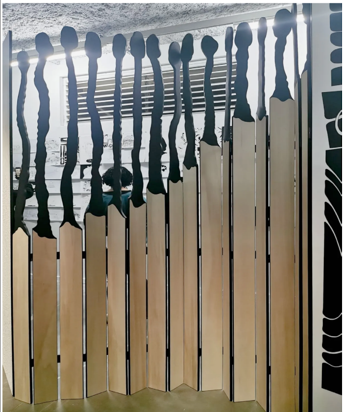
Mrzyk & Moriceau – Meilleurs Vœux de la Jamaïque au Mrac à Sérignan

En plus de ces visions jamaïcaines, Mrzyk & Moriceau dormaient très mal. La nuit, des effets d'échelles, de matière, de superposition et de perspectives sauvages furetaient autour de leur maison en essayant de rentrer. Le couple devait constamment rester vigilant. Et puis toujours cette sensation étrange d'être observé par un canard.