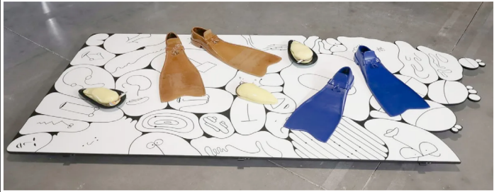
Mrzyk & Moriceau – Meilleurs Vœux de la Jamaïque au Mrac à Sérignan

Ou encore, en regardant l'ombre de son hutia, un petit garçon les alerta sur le risque d'une plongée sous-marine fatale mettant en cause des mocassins-palmes défectueux, il fallait éviter à tout prix de chauffer ce type de modèle pendant leur séjour.