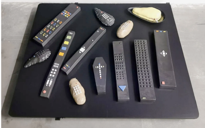
Mrzyk & Moriceau – Meilleurs Vœux de la Jamaïque au Mrac à Sérignan

Dès le lendemain ils achetèrent une scie sauteuse.